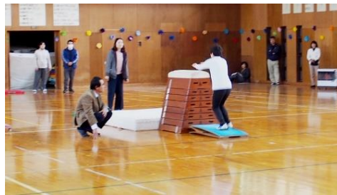
跳び箱が得意な人