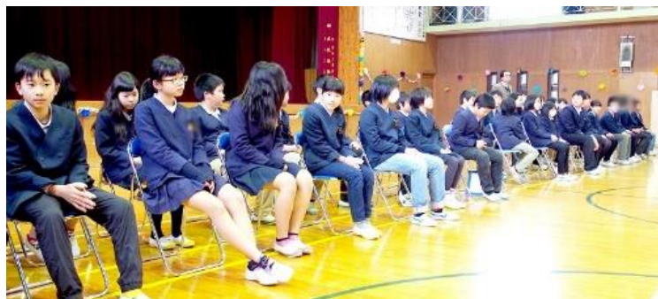
5年生の先導で、6年生が入場しました。皆拍手で迎えました。