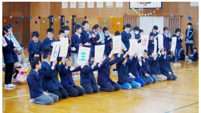
5年生は、鍵盤ハーモニカの演奏で「6年生卒業おめでとう」のメッセージを送りました。