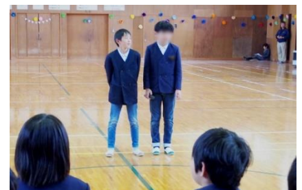
終わりの言葉を5年生が言いました。