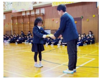
3年生は、6年生へのメッセージを呼びかけ形式で伝えました。プレゼントを渡しました。