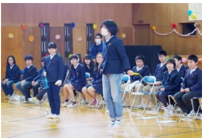
縄跳びが得意な2人