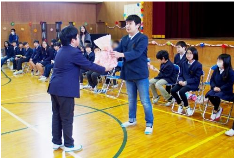
5年生のプレゼント