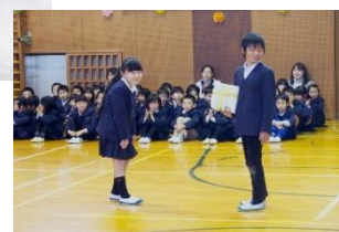
2年生は、詩の暗唱とランドセルを使ったパフォーマンスです。その後、プレゼントを渡しました。