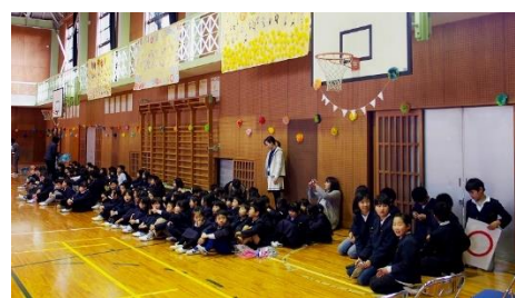
各学年が作成した壁飾りや5年生の飾りつけで会場を華やかにしました。