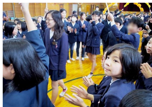
最後に1～5年生全員で花道をつくり、拍手で6年生を送りました。5年生が花吹雪も用意してくれました。とても温かい6年生を送る会になりました。