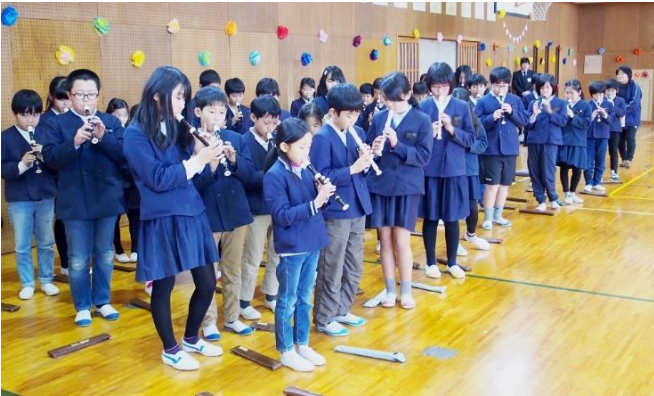
4年生は、リコーダーで「オーラリー」を演奏しました。