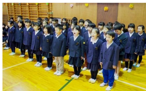
次は、各学年の出し物・プレゼントです。1年生は、最初にプレゼントを渡し、その後、歌を歌いました。