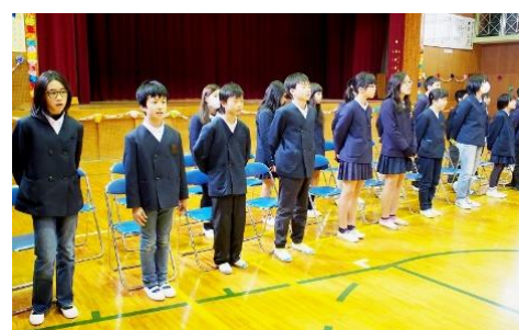
5年生が、始めの言葉をいいました。最初に全員で「世界に一つだけの花」を歌いました。次に〇×クイズをしました。